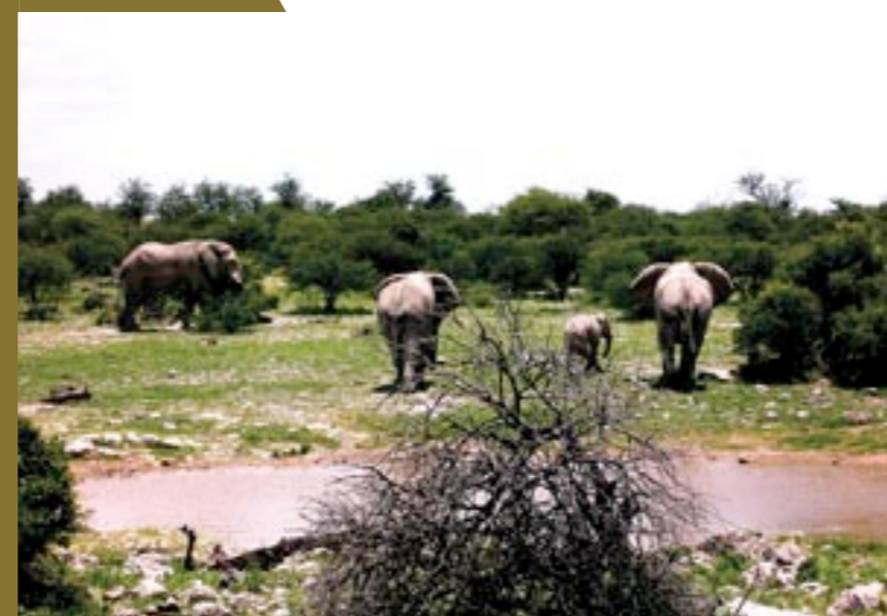
OVER: Elefantene var del av en kjempeflokk på 35 dyr i Etosha nasjonalpark.

For de som er lei av champagne fra før, så kan man dra på en 5-6 timers fisketur. Sjansen for å få masse fisk er stor, men sesongen for dyphavsfiske er tidlig høst, så fiske foregår på ganske grunt vann resten av året.