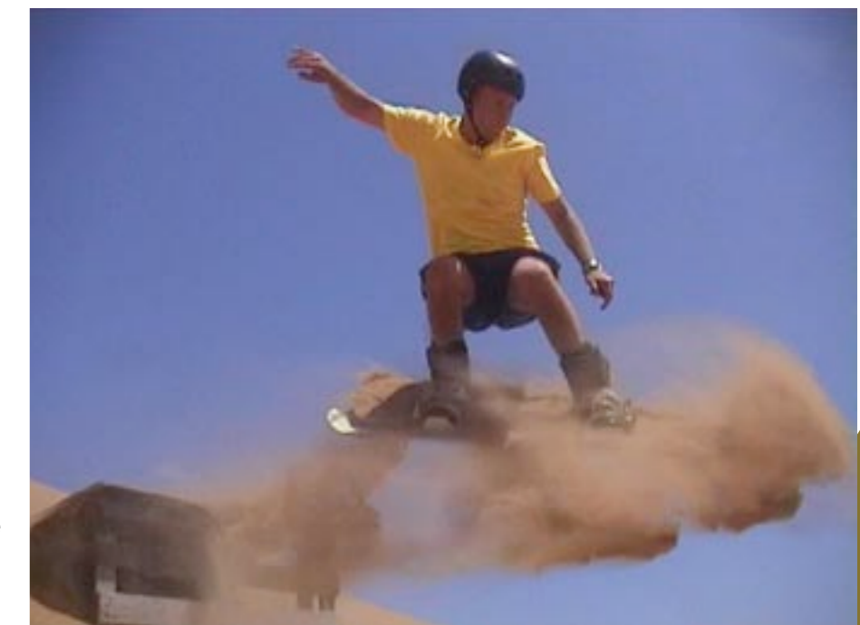
OVER: Artikkelforfatteren på sandboarding.