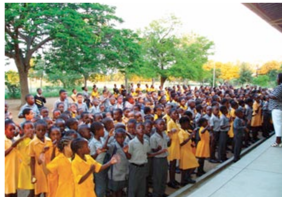
MORGENSAMLING: Hver mandag morgen samles elevene i sjette klasse.