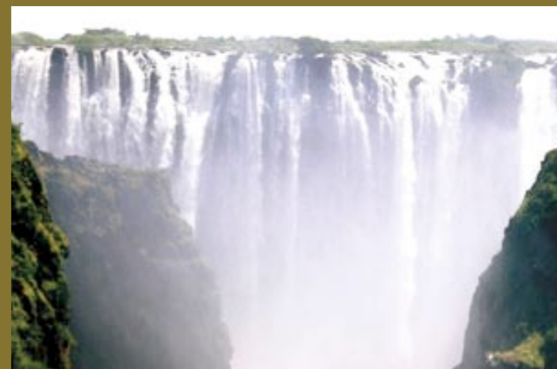
OVER: Deler av Victoria Falls.