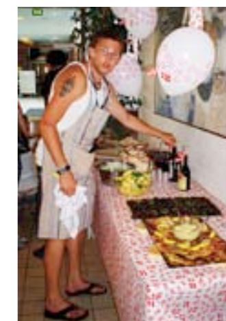
LOKALE BIDRAG: Deltakerlandene lagde hver sin lokale buffet. Her er danskenes bidrag.

eksotiske utseende kunne han lett bli tatt for å være en japansk turist, en turist vi også er godt kjent med her i Norge. Det kom latterbrøl på latterbrøl fra salen som til slutt bunnet ut i stående applaus. Så kom vi til den nordiske buffeen. Det vi mangler, for eksempel av ren musikalsk kvalitet i MGP, tar vi igjen og vel så det med vårt kulinariske norske kjøkken. Fredag kveld var det klart for de Nordiske olympiske leker . Her var det aktiviteter som steking av egg på sølvfolie med litt dopapir under, kakelaging, eggkasting/eggmottak, kasting av bokser i vannbøtter (kun i Danmark, vi ville ikke hatt råd eller vilje til det i Norge) osv. Det gikk som det