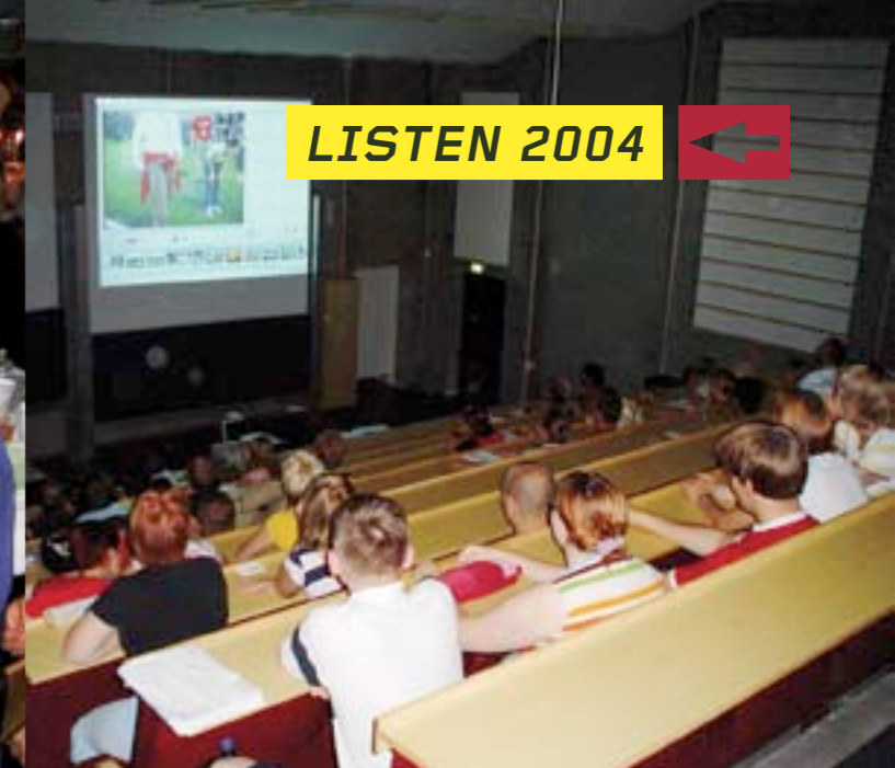
FILM: Deler av konferansen oppsummeres på film.