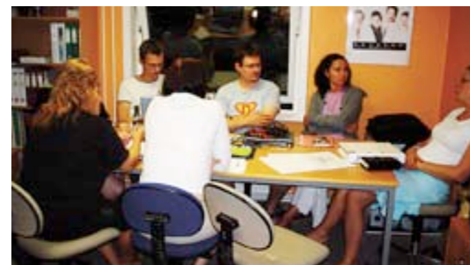
LISTEN BOARD 2 ansvarlige fra hver nasjon i dyp konsentrasjon kvelden før konferansestart.

mer og syndromer. Dette er en stor utfordring for lærere og medelever og det viktigste for både nye og erfarne lærere, er kunnskap og informasjon om disse elevene og deres utfordringer i forhold til skolesituasjonen. Det er i st. meld. 30 fra år lagt opp til større integrering i klassene gjennom økt tilrettelagt undervisning på bekostning av spesialundervisning. Det vil si at barn med eventuelle lærevansker i økt grad skal være i klassen fremfor å bli tatt ut og