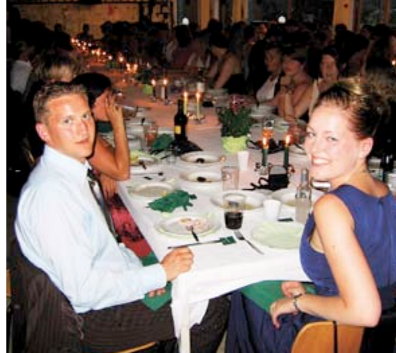
PYNTET TIL FEST: Nordisk forbrødring under gallamiddagen.

Torsdag var den store kulturelle dagen av konferansen. Hver delegasjon skulle underholde med innslag fra de forskjellige landene til nordisk kveld, og hvilken underholdning det ble! Den norske delegasjonen hadde ikke noe problem med å finne tema siden Melodi Grand