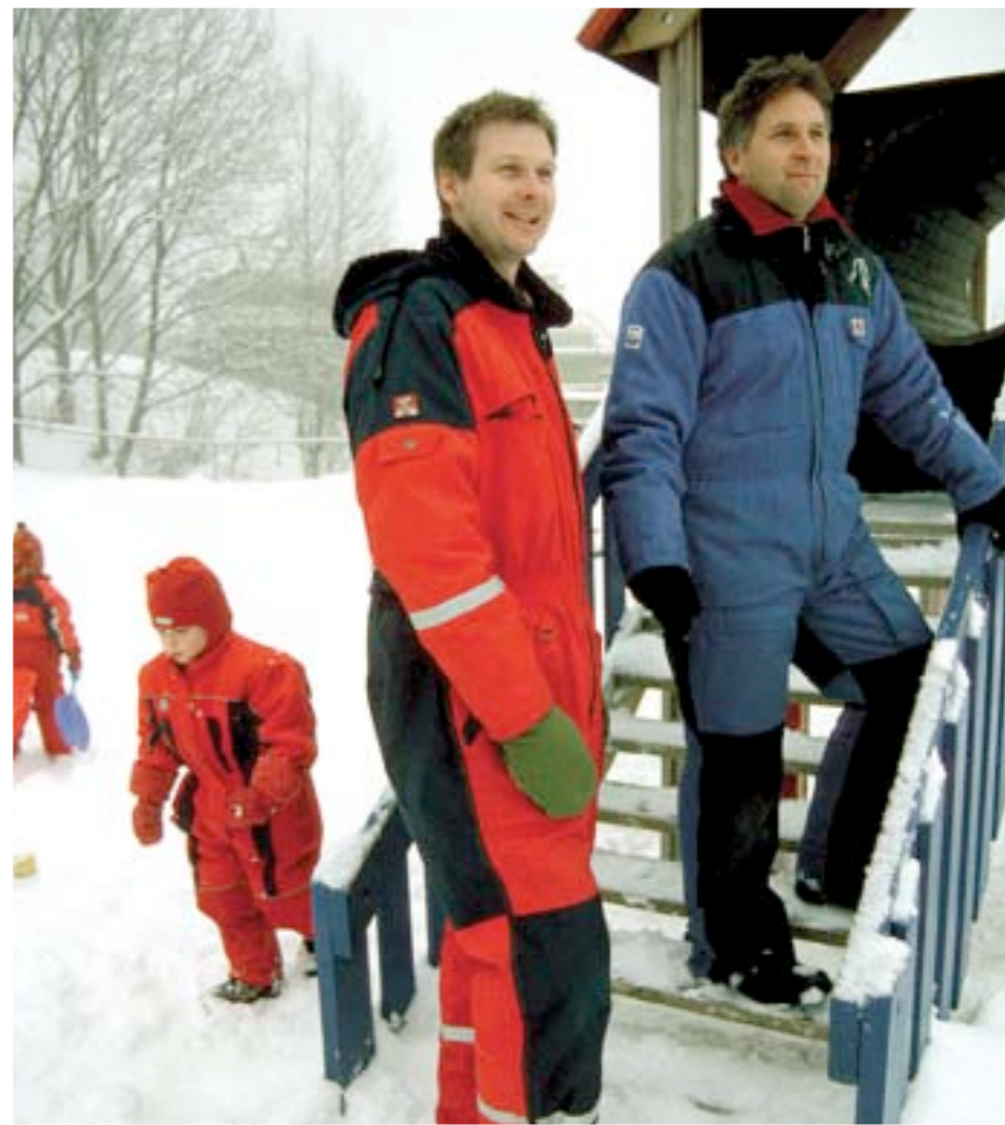
IDENTITETSPROBLEM: Mange menn føler seg etterlatt av likestillingsutviklingen. Samtidig er menn en sårt trengt mangelvare i norske barnehager og skoler.

Et annet problem er status eller snarere mangelen på status som læreryrket har opparbeidet seg. I dag er det stor uenighet i Norge om hvorvidt det skal være opptakskrav til utdanningen eller ikke. Uten å gå for mye inn på den debatten her, så er den høyaktuell i forhold til økt status i læreryrket. Og alle vet at status + menn = kjærlighet. Men et annet argument som står i rapporten fra 2001: « Like viktig som å ha kompetanse på kunnskap er å tilegne seg pedagogisk formidlingsevne » og det blir vanskelig å være uenig i det. Faglig kunnskap og pedagogiske evner er de viktigste ingrediensene i en god lærer, men i følge KUF-rapporten bør det satses mer på det pedagogiske i utdanningen enn det gjør i dag. Som tiltak nevnes det også som en valgfri del med rom for eventuelle grunnfag eller tidligere studier. Dette kan være en sentral del av den enkelte students lærerutdanning på grunn av det store rekrutteringspotensialet i grunnfagsstudenter på universiteter – både til allmennlærer- og praktisk-peda-