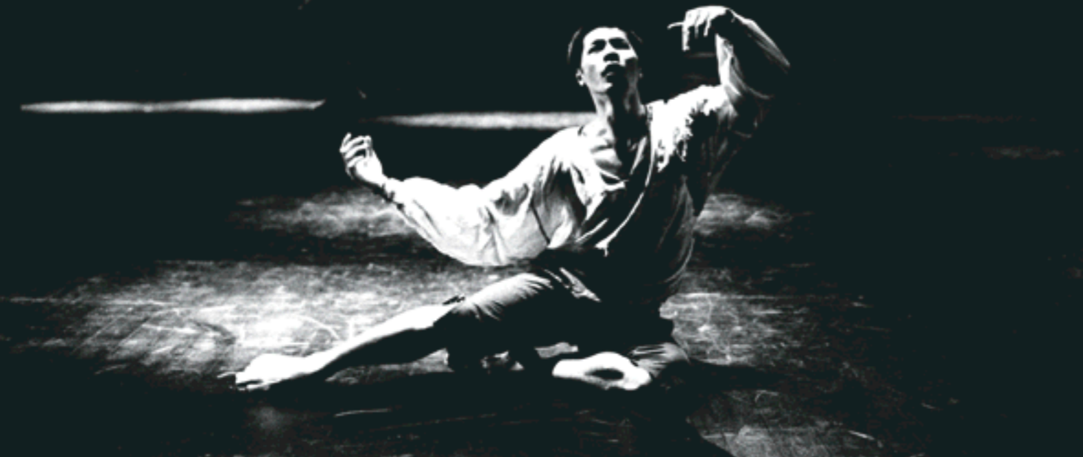
STOR VARIASJON: BlackBox er et annerledes teater som barneteater på alvor.