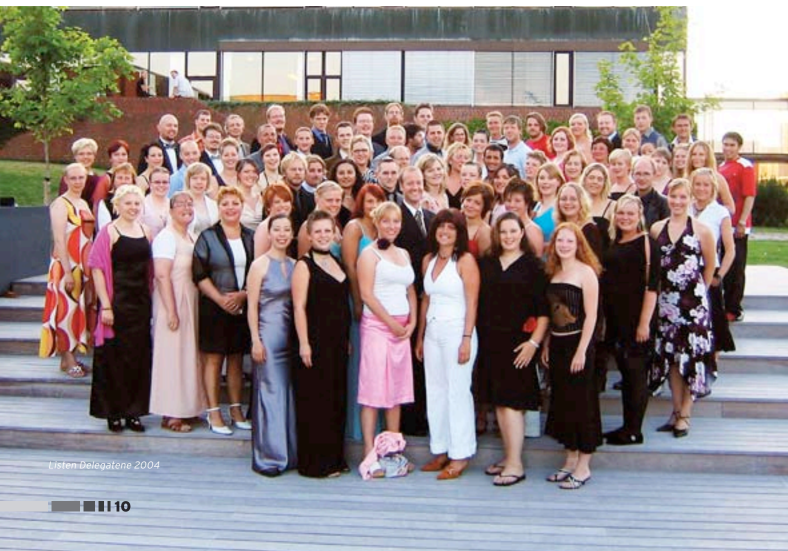
Listen Delegationene 2004

«Det kom latterbrøl på latterbrøl fra salen som til slutt bunnet ut i stående applaus»