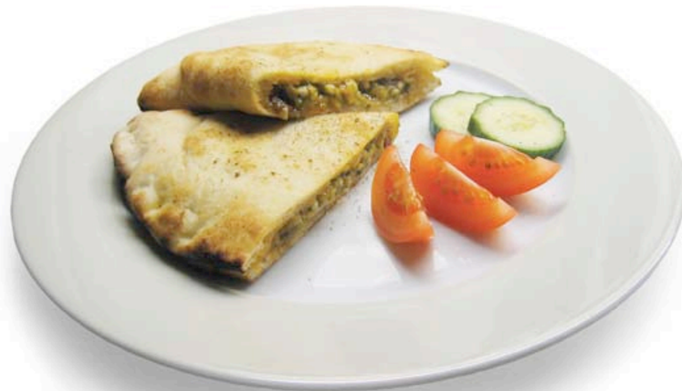
FLERE ALTERNATIVER: Calzone fåes også kjøpt ferdig i mange smaksvarianter på Deli de Luca (som denne med pesto), men den blir definitivt best hvis du lager den selv.